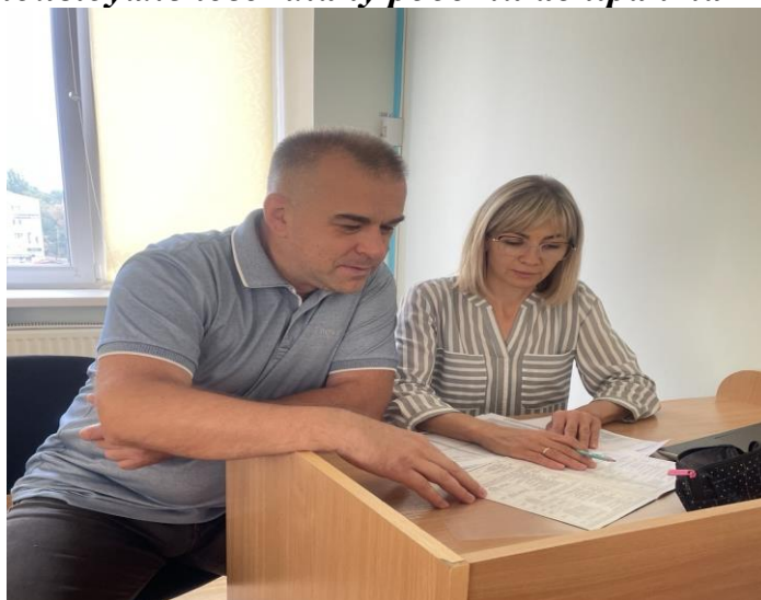
Формування індивідуального навчального плану, індивідуального плану наукової роботи