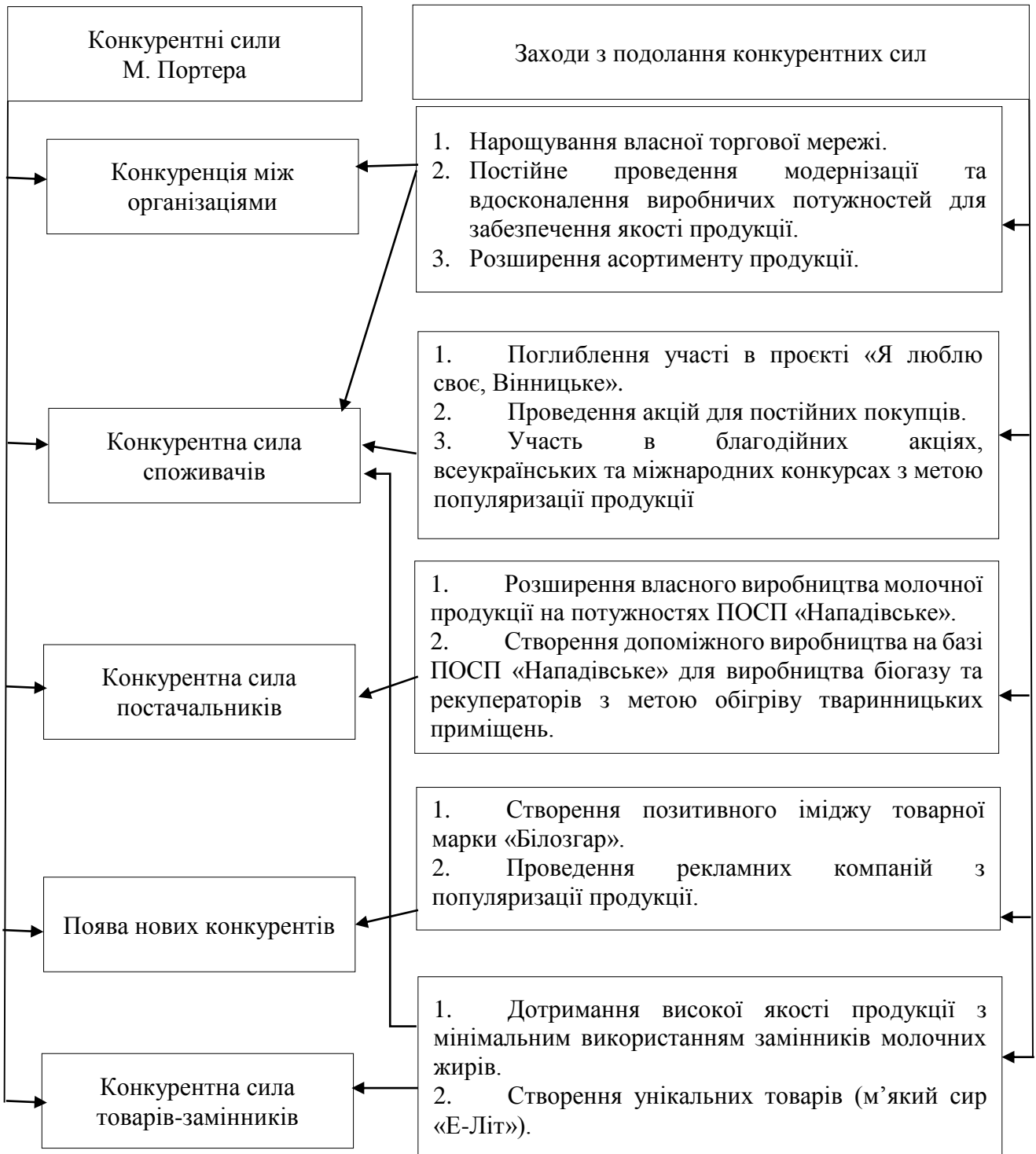
Рис. 3. Модель формування конкурентних переваг ТОВ «Літинський молочний завод»