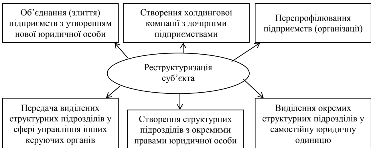
Рис. 1. Організаційні форми здійснення реструктуризації суб'єкта господарювання

Визначено, що вибір варіанта реструктуризації підприємства повинен полягати у визначенні одного напрямку, який повністю відповідатиме вимогам і пріоритетам розвитку підприємства, високій технологічності виробництва та конкурентоспроможності продукції (рис. 1).