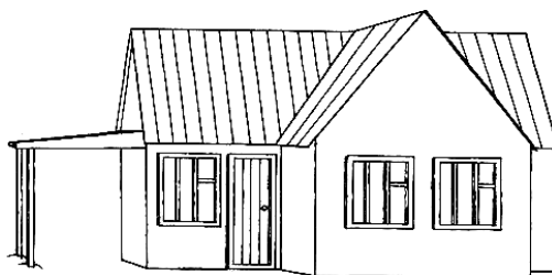
Рис 1. Схема зеленого будинку

Текст текст текст текст текст текст текст текст текст текст текст текст текст текст текст (рис.1).