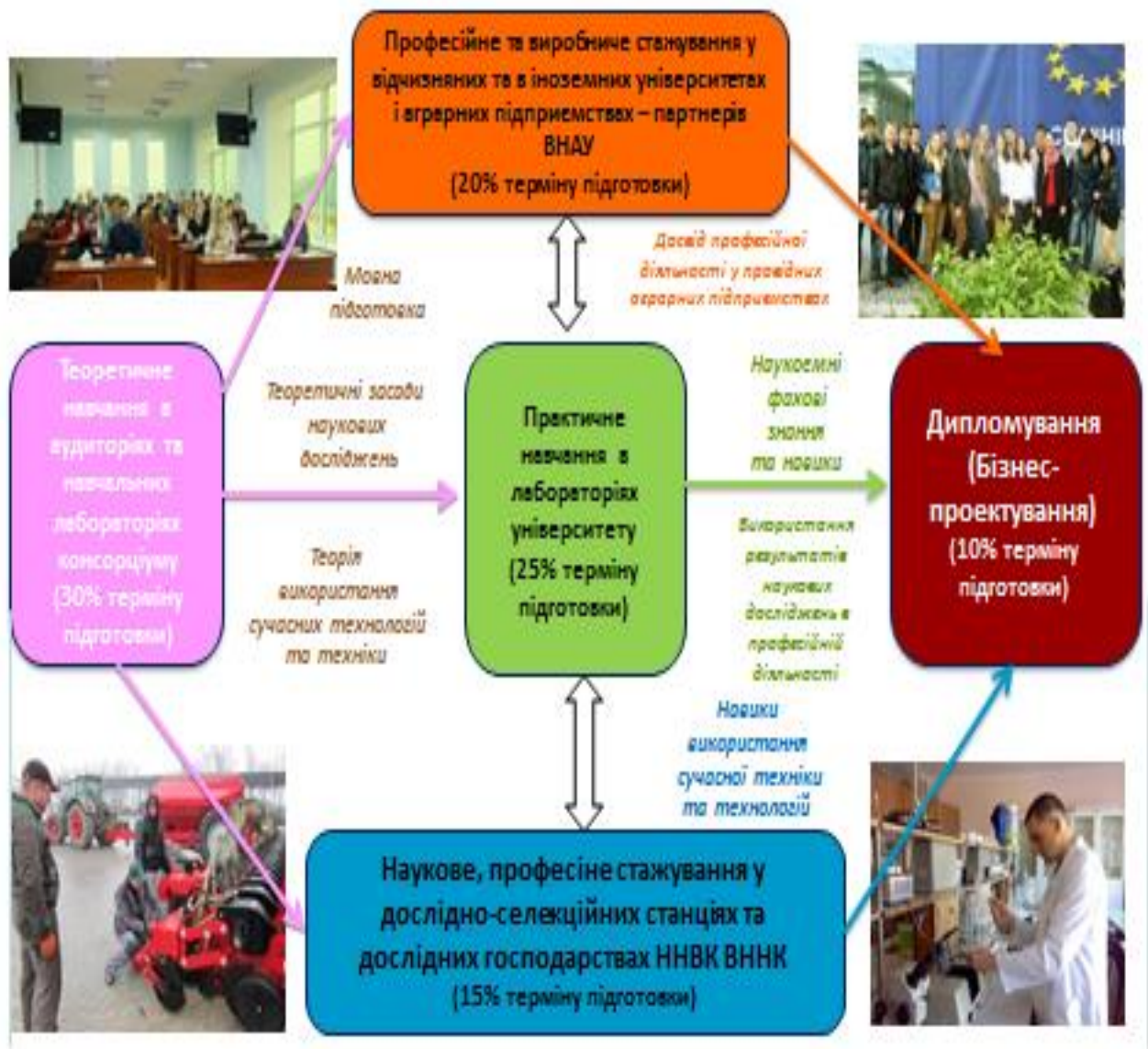
Схема 2. Структура освітніх програм підготовки фахівців у Вінницькому національному аграрному університеті

Молодший бакалавр - це освітньо-професійний ступінь, що здобувається на початковому рівні (короткому циклі) вищої освіти і присуджується вищим навчальним закладом у результаті успішного виконання здобувачем вищої освіти освітньо-професійної програми, обсяг якої становить 90-120 кредитів ЄКТС.