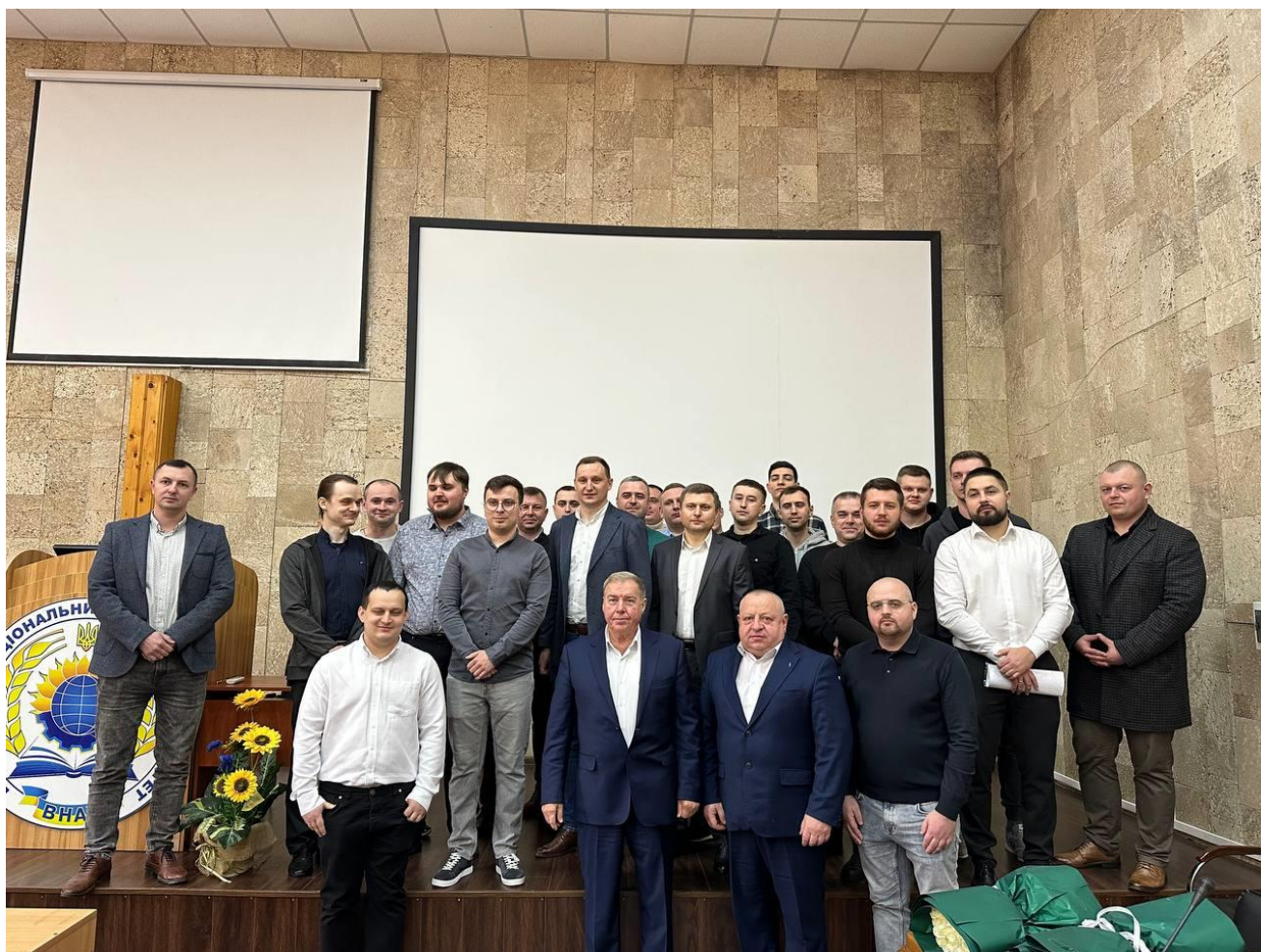
Рис. 1. Затвердження тем дисертаційної роботи та призначення наукових керівників аспірантам першого року, ВНАУ, 26.02.2024 р.