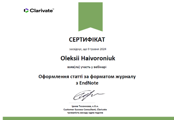
Рис.5. Сертифікати про участь у вебінарах від компанії Clarivate